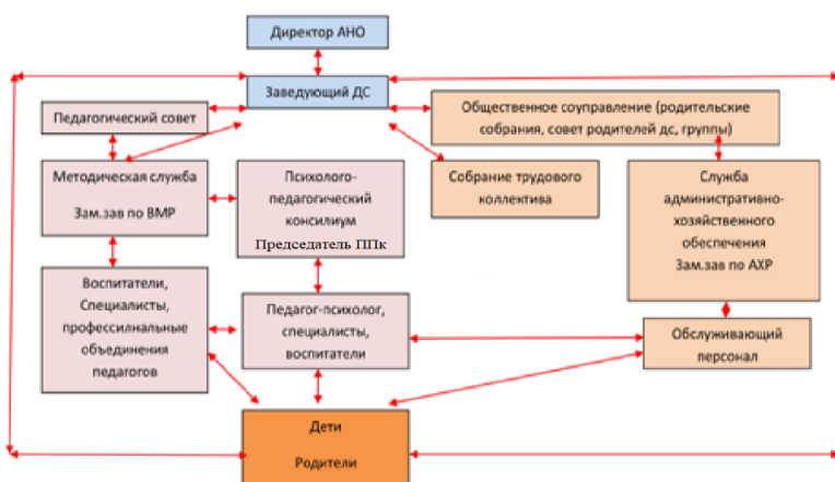
Рис. 1. Система управления детским садом

Данная структура управления позволила обеспечить координацию деятельности педагогической, и психологической служб детского сада. В результате эффективного взаимодействия были успешно решены вопросы, связанные с соблюдением санитарного режима по назначению врача, организацией мероприятия по закаливанию детей; обеспечением организации оздоровительных мероприятий, соблюдением режима дня, правильным проведением утренней гимнастики, физкультурных занятий и прогулок детей и другое.